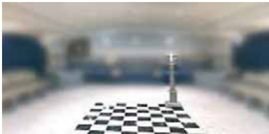
Fig. 1. L'objet plat appelé Tableau ou Tapis.

Commençons par inventorier l'existant. Parmi les objets partagés par tous les Rits, nous trouvons trois supports de lumière, appelés ici et là chandeliers ou candélabres , ailleurs, parfois, colonnettes ; puis trois vertus, Sagesse , Force et Beauté ; ensuite une triade particulière, désignée ici comme les Trois Grandes Lumières de la Maçonnerie ( Great Lights ), là comme les Trois Lumières secondaires ( Lesser Lights ) : le soleil , la lune , le maître maçon ; et parfois aussi un objet plat appelé, ici, Tapis de Loge, là, Tableau de Loge ( Tracing-Board ), qui pourra être, particulièrement en France, en liaison directe avec les chandeliers.