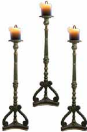
Fig. 2. Trois chandeliers

chaires des trois Officiers principaux. En ce qui concerne le RY, la disposition est encore différente, les chandeliers sont placés au centre de la Loge, et associés à l'autel.