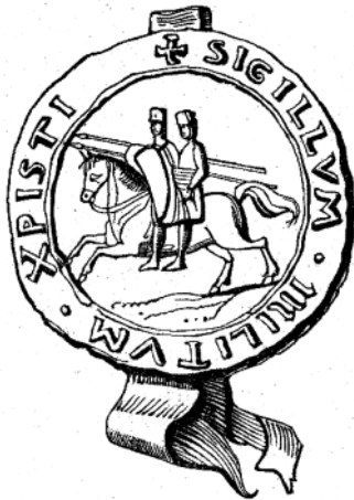
Fig. 10 : Sceau de l'OT. Semblable à celui de la chapelle de Rosslyn ?

Sur l'un des encorbellements d'une fenêtre de l'aile sud (« E » sur la planche 11, voir p. 124) figure un cheval et deux personnages. On a affirmé qu'il s'agissait là d'une gravure du sceau de l'OT, liant ainsi la chapelle de Rosslyn à l'Ordre. Si c'est avéré, l'importance réside dans le fait que l'OT fut supprimé en 1312, tandis que la construction de la chapelle ne démarra qu'en 1446. Il serait ainsi suggéré que, plus de cent trente ans plus tard, l'OT existait toujours et avait quelque lien avec la chapelle. Cette moulure ressemble-t-elle au sceau de l'OT (fig. 10) ? Le sceau montre deux chevaliers montés sur un seul cheval, on dit qu'il représente la pauvreté des premiers membres de l'Ordre.