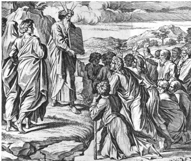
Planche 17 : Gravure du XVIII e siècle, Moïse et les dix commandements. Noter les « cornes ».

Aaron et les enfants d'Israël, voyant les cornes orner la face de Moïse, avaient peur de s'approcher 67 .