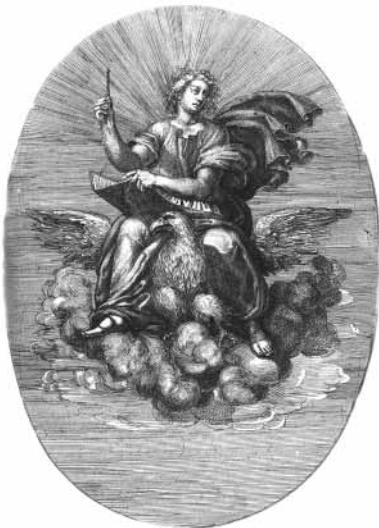
Planche 28 : Saint Jean l'Évangéliste – le « saint patron » de la franc-maçonnerie d'Écosse.