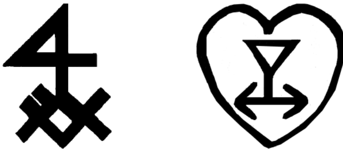
Fig. 7 et 8. Des marques de maçons ?