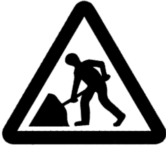
Fig. 6. Un signe, non un symbole

D'autre part, un symbole est censé transmettre un concept, une idée, une croyance, quelque chose d'intangible, de spirituel, etc. À l'inverse du signe, il est destiné à travailler sur plusieurs niveaux. Ainsi, un signe ne peut jamais devenir un symbole, mais les symboles sont constamment réduits au stade de simples signes. Les symboles sont chargés d'un sens métaphorique, pas les signes. Un symbole peut ainsi être des plus variés, une image visible, un mot écrit, une action, comme dans un rituel, voire se retrouver, à l'occasion, dans un assemblage.