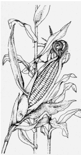
Fig. 9 Comme dans la chapelle de Rosslyn ?

La présence de sculptures de blé indien, ou maïs, dans la chapelle de Rosslyn a été citée comme preuve que des Européens furent en Amérique avant que Christophe Colomb ne la « découvre » en 1492 84 . Le maïs est une plante qui requiert des soins constants, plutôt que de pousser à l'état sauvage. Originaire de l'Amérique du Nord, probablement de ce qu'on appelle depuis le Mexique, il était cultivé par les Amérindiens, ne supporte pas le froid et n'est pas naturellement adapté au climat du Nord-Est, du territoire connu sous le nom de Canada. L'affirmation que ces gravures représentent bien du maïs repose sur deux « faits » : qu'ils sont du « blé indien » et que la chapelle de Rosslyn fut bâtie en 1446. Si on compare les gravures avec du véritable maïs, les deux paraissent totalement différents (voir planche 26, hors-texte et fig. 9). Si les gravures dépeignent réellement du maïs, il s'agirait alors d'une découverte capitale, qui ne signifierait rien de moins que les Écossais ont découvert l'Amérique !