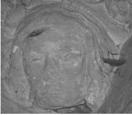
Planche 15 : Tête de l'apprenti assassiné. Noter la marque sur la tempe droite.

Cette évocation est donc plus précise encore que celle de Forbes. La balafre, ou blessure, est ici représentée par un barbouillage de pigment coloré. D'autres aussi relèvent la manière dont la blessure est peinte :