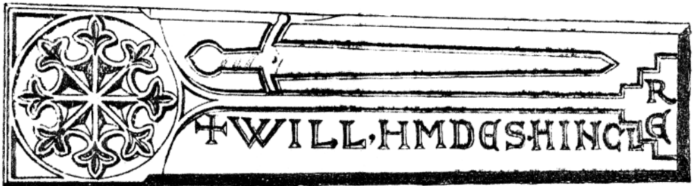
Fig. 11 : Preuve que William Saint-Clair fut un chevalier de l'OT ?

Les lettres ont été retaillées sur une précédente inscription, procédé qui a induit en erreur. Il y avait apparemment trois mots au préalable, recouverts par la suite pour signifier : WILL HDMS HIN. Trois autres lettres, « LER », ont été rajoutées dans la base, et toutes les lettres font une approximation du nom du nouveau « pensionnaire » de la dalle : (WILL. HMDES.HINCLER) – William Sincler 89 . La plinthe moderne porte la légende : « WILLIAM DE St. CLAIR KNIGHT TEMPLAR », ce qui est très différent de ce que porte la dalle elle-même, et doit être une