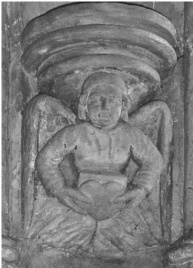
Planche 21 : Le cœur de Robert I er Bruce ?

est dédiée. La gravure est donc un symbole du salut par Jésus-Christ, qui est littéralement offert au spectateur. D'autres gravures, dans la chapelle de Rosslyn représentent également Jésus-Christ, en particulier un ange tenant une couronne d'épines, avec trois clous traversant la couronne et entrant dans le cœur, qui représente le Christ crucifié (voir planche 22, hors-texte). Le symbole d'un cœur, dans les églises médiévales, revient fréquemment (exemple à Haddington, voir planche 23, hors-texte), et symbolise le sacré cœur de Jésus-Christ et son amour pour l'humanité. La dévotion au sacré cœur existe depuis le XI e siècle, au moins 79 . La raison précise de ce désir de faire passer un symbole chrétien si connu pour ce qu'il n'est pas suggère qu'elle fait partie du processus de déchristianisation de la chapelle et de son contenu, mais peut aussi avoir un symbolisme dual, en représentant Lady Margaret Douglas (voir p.147).