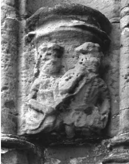
Planche 14 : Encorbellement de la fenêtre ouest, à l'extérieur sud de la chapelle. Une initiation maçonnique ?

L'encorbellement, en bas à gauche de la fenêtre externe sud-ouest de la chapelle, est apparemment une gravure de deux personnages (voir planche 14, ci-dessous). On dit qu'elle représente un candidat introduit dans une loge maçonnique 48 . Le personnage de droite est supposé avoir les yeux bandés, conduit par le personnage de gauche, à l'aide d'une corde tenue par le conducteur et qu'on dit entourer le cou du « candidat ». Cet encorbellement a sans doute été gravé voici cinq cents ans, et le comparer avec les pratiques de la franc-maçonnerie moderne est dangereux, en ce que cela suggère implicitement, non seulement que la franc-maçonnerie existait voici cinq cents ans, mais aussi que le cérémonial maçonnique était le même qu'actuellement.